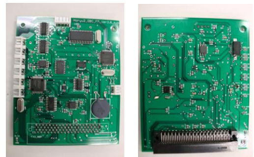
図 3 作成した OBC 基板 (フライトモデル)

本研究で開発した OBC 基板は上記に示した熱真空試験をはじめ、様々な試験を行い検証した結果、当初予定していたすべての設計項目を達成できる事を確認した。この事により実際に宇宙環境においても正常に動作することが可能であると考えられる。